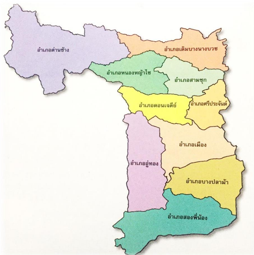
ภาพที่ 1 แผนที่อำเภอในจังหวัดสุพรรณบุรี

สุพรรณบุรี เป็นจังหวัดหนึ่งในเขตภาคกลางด้านทิศตะวันตกของประเทศไทย ตั้งอยู่บนพื้นที่ราบลุ่มแม่น้ำท่าจีน มีพื้นที่ทั้งหมดประมาณ 5,358.01 ตารางกิโลเมตร หรือประมาณ 3.35 ล้านไร่ อยู่ห่างจากกรุงเทพมหานครประมาณ 107 กิโลเมตร แบ่งเขตการปกครองออกเป็น 10 อำเภอ คือ อำเภอเมืองสุพรรณบุรี อำเภอดอนเจดีย์ อำเภอด่านช้าง อำเภอเดิมบางนางบวช อำเภอบางปลาม้า อำเภอศรีประจันต์ อำเภอสองพี่น้อง อำเภอสามชูก อำเภอหนองหญ้าไซ และอำเภออู่ทอง